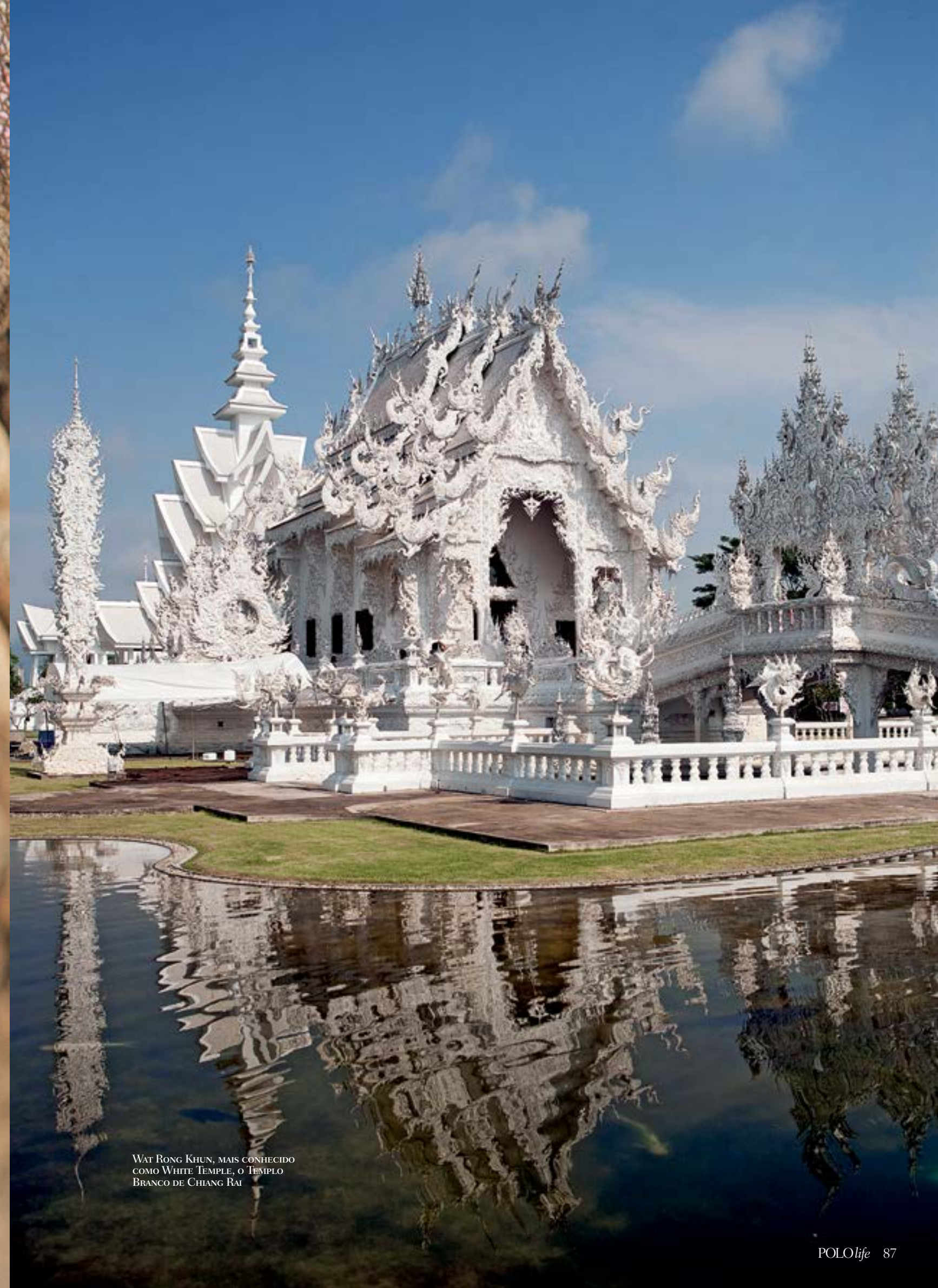
WAT RONG KHUN, MAIS CONHECIDO COMO WHITE TEMPLE, O TEMPLO BRANCO DE CHIANG RAI