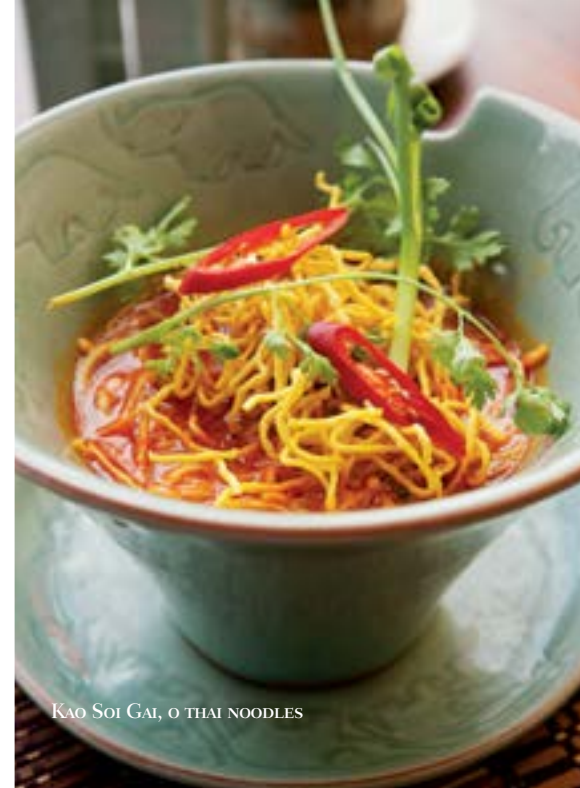
KAO SOI GAI, O THAI NOODLES