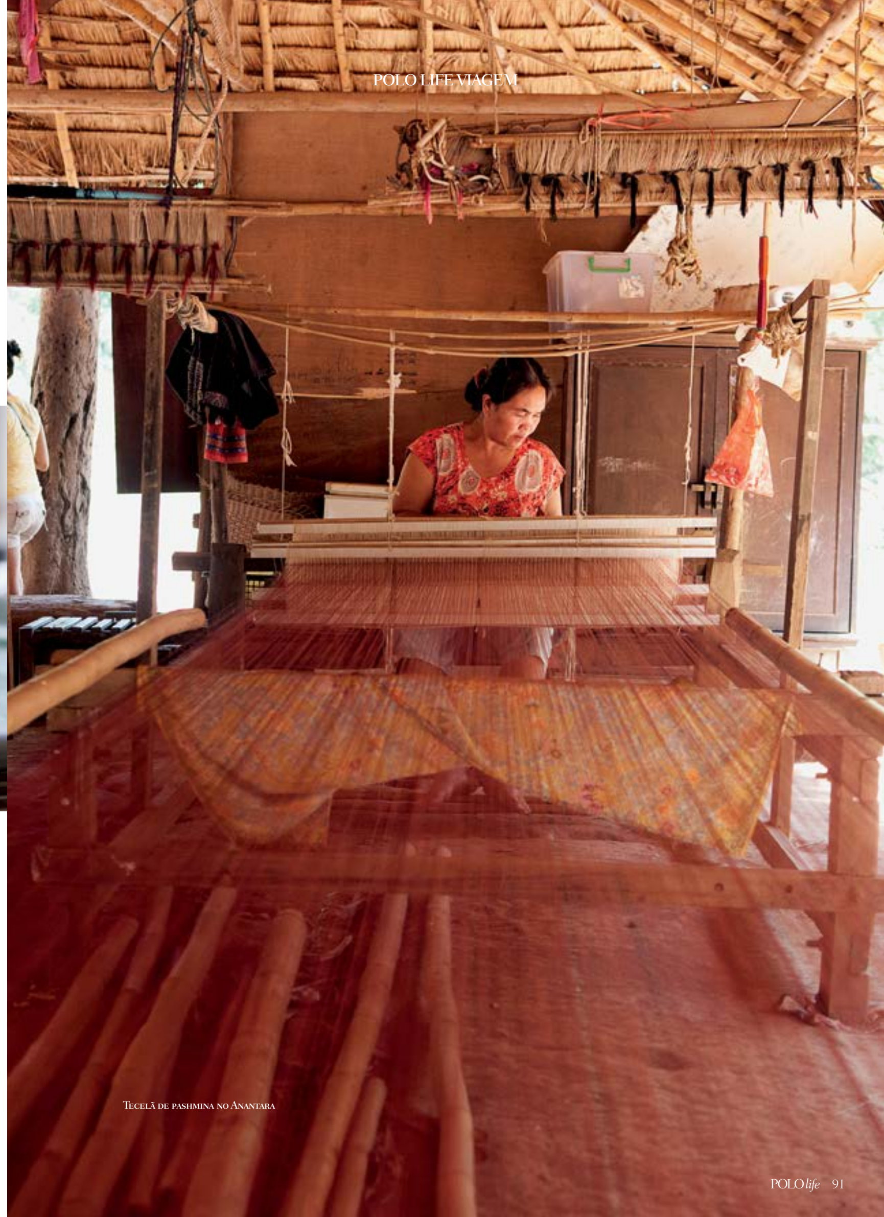
POLO LIFE VIAGEM