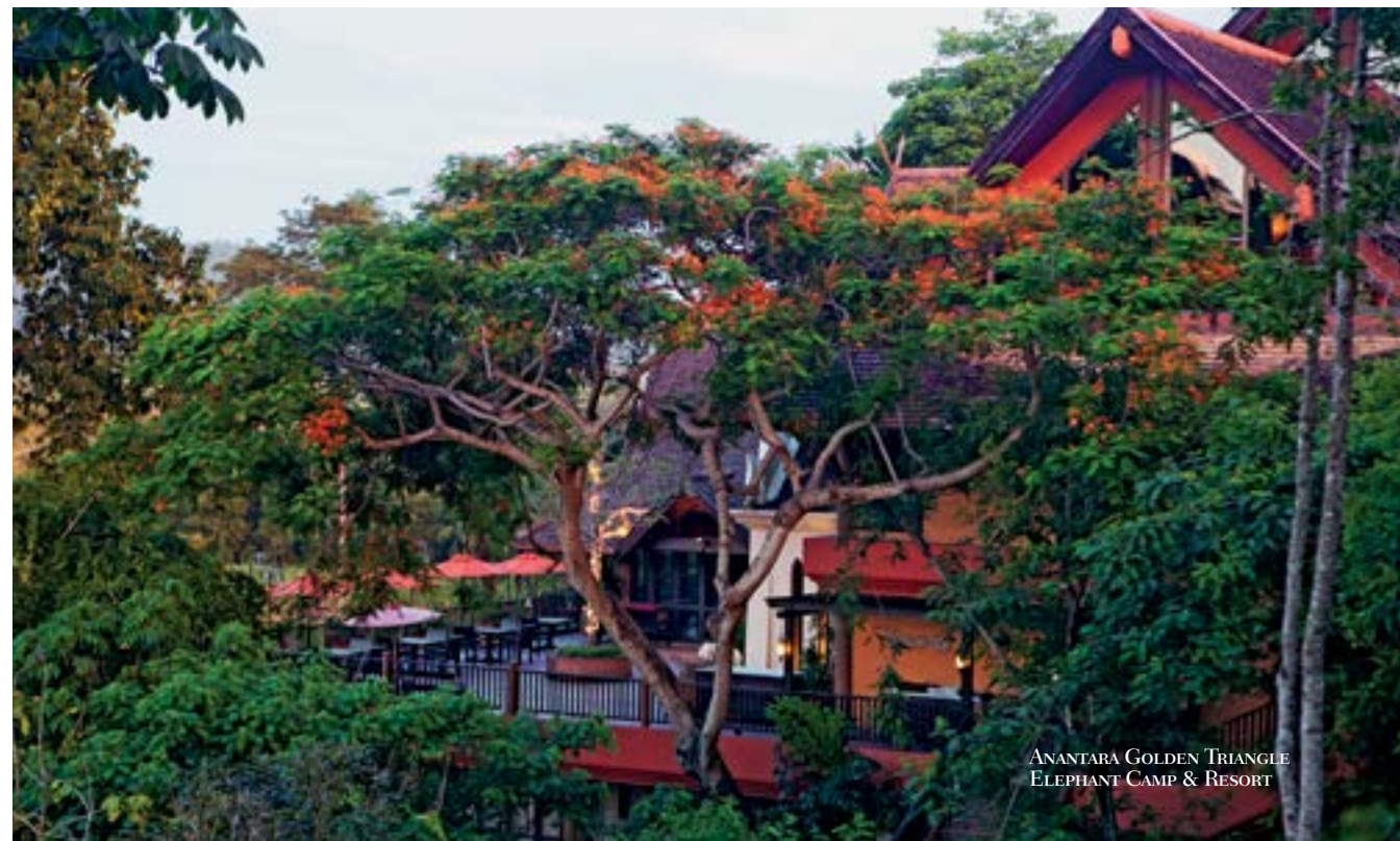
ANANTARA GOLDEN TRIANGLE ELEPHANT CAMP & RESORT

6 h da manhã. O sol já lança suas primeiras luzes sobre as colinas verdejantes e suaves do Triângulo Dourado, no norte da Tailândia. O dia será, como sempre, longo e abrasador. A temperatura, que às 7h da manhã já era de 33 oC, vai subir até próximo dos 40 oC. Estamos na mítica fronteira tríplice entre a Tailândia, o Laos e Myanmar, às margens do caudaloso rio Mekong. Durante o dia, as pessoas vivenciarão uma experiência inesquecível. Em um hotel-reserva com 125 hectares, o Anantara Golden Triangle, vivem 26 elefantes. Todos os animais chegaram com um histórico semelhante de maus-tratos, como trabalho excessivo, má nutrição e abandono. Em seu processo de reabilitação, pouco a pouco os mahuds, como são conhecidos os tratadores de animais, vão reconquistando sua confiança e os elefantes tornam-se mais tranquilos e sociáveis. A Tailândia é um país com uma tradição milenar de manejo de elefantes para o transporte e trabalho pesado. Há também, em outros lugares do país, shows com os animais, onde eles jogam futebol, pintam quadros e dão demonstrações de força. Não há como esquecer que nesse processo de aprendizado os animais sofrem maus-tratos e castigos. À medida que se adquire consciência de que essas atividades são prejudiciais a eles, tais práticas diminuem. Há,