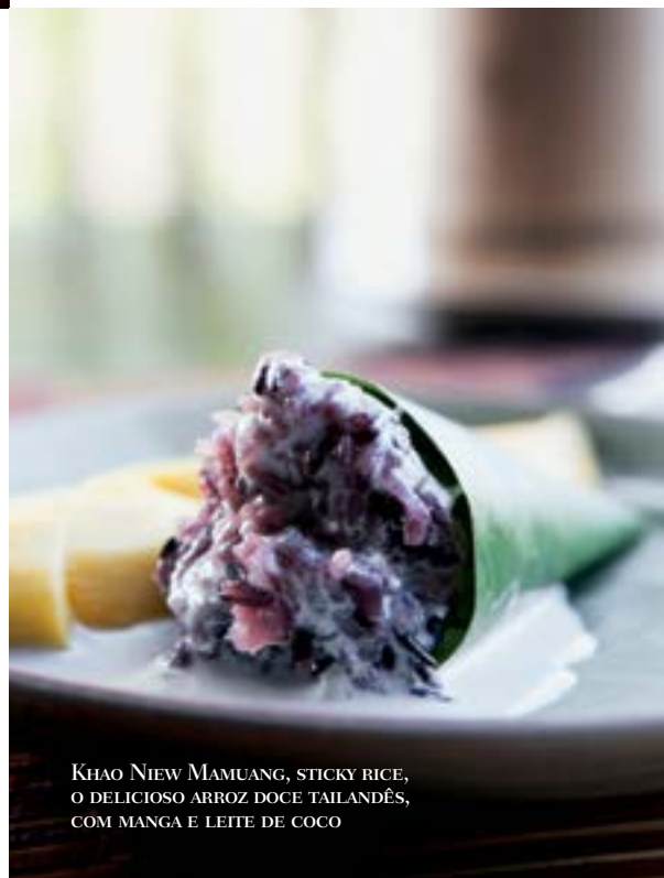
KHAO NIEW MAMUANG, STICKY RICE, O DELICIOSO ARROZ DOCE TAILANDÊS, COM MANGA E LETE DE COCO

Anantara Golden Triangle Elephant Camp & Resort www.goldentriangle.anantara.com