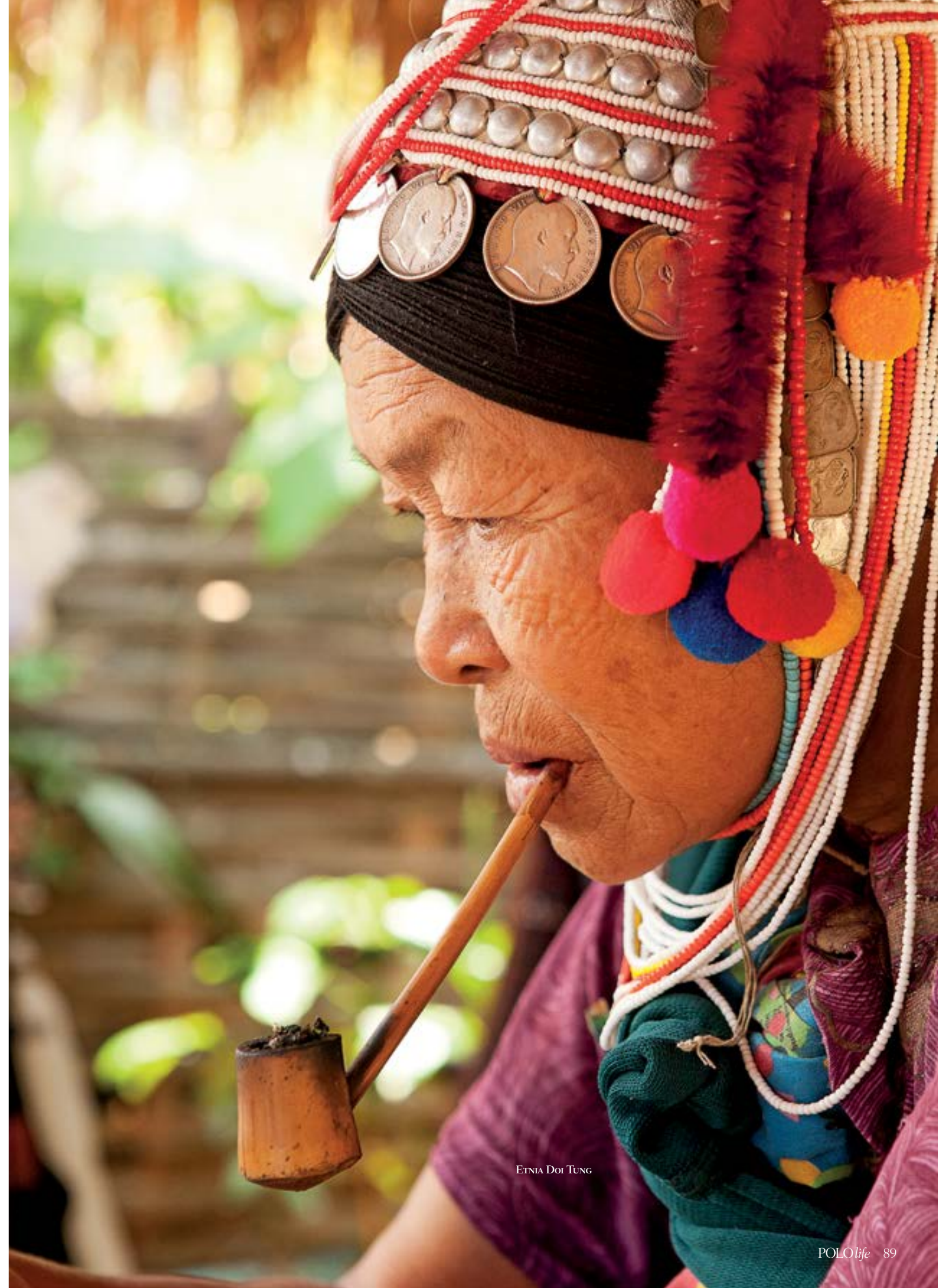
ETNIA DOI TUNG

no entanto, outras formas de manejo muito mais humanizadas, que proporcionam às pessoas momentos inesquecíveis e dão a elas a percepção de como esses animais são sensíveis e inteligentes. No Anantara, com o passar do tempo, os elefantes voltam a viver em grupo e a interagir com os visitantes. Elefantes que nasceram e cresceram sob manejo precisam ser manejados por toda a vida. Não há como reintegrá-los à natureza sem dispor de vastíssimas áreas controladas. Machos disputam brutalmente territórios e fêmeas, e animais de origens diferentes e históricos difíceis jamais formarão um bando com estrutura hierárquica semelhante à de elefantes na natureza. Uma vez reabilitados, não fazem mais trabalhos pesados nem shows, alimentam-se fartamente de vegetais e cana-de-açúcar e pastam livremente. O Anantara Golden Triangle fica nos arredores da pequena Chiang Rai, situada às margens do Mekong, que nasce nas planícies do Tibete, percorre quase 1.600 km atravessando seis países, até sua foz no Mar da China Meridional. Diferente da vizinha Chiang Mai, a segunda maior cidade da Tailândia, com quase 2 milhões de habitantes, em Chiang Rai vivem menos de 200 mil pessoas. A região é antiga produtora de ópio. Nas décadas de 1950 e 1960, a mãe do rei Bhumibol da Tailândia percorreu com o exército centenas de comunidades tribais nas montanhas, onde