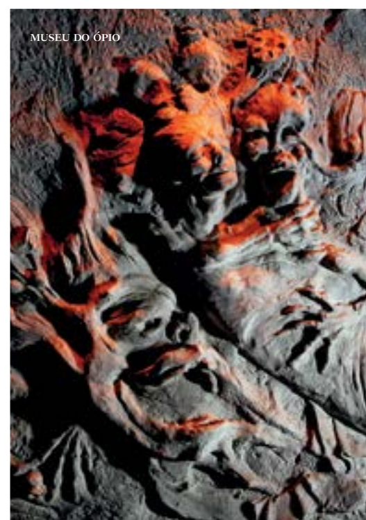
MUSEU DO ÓPIO